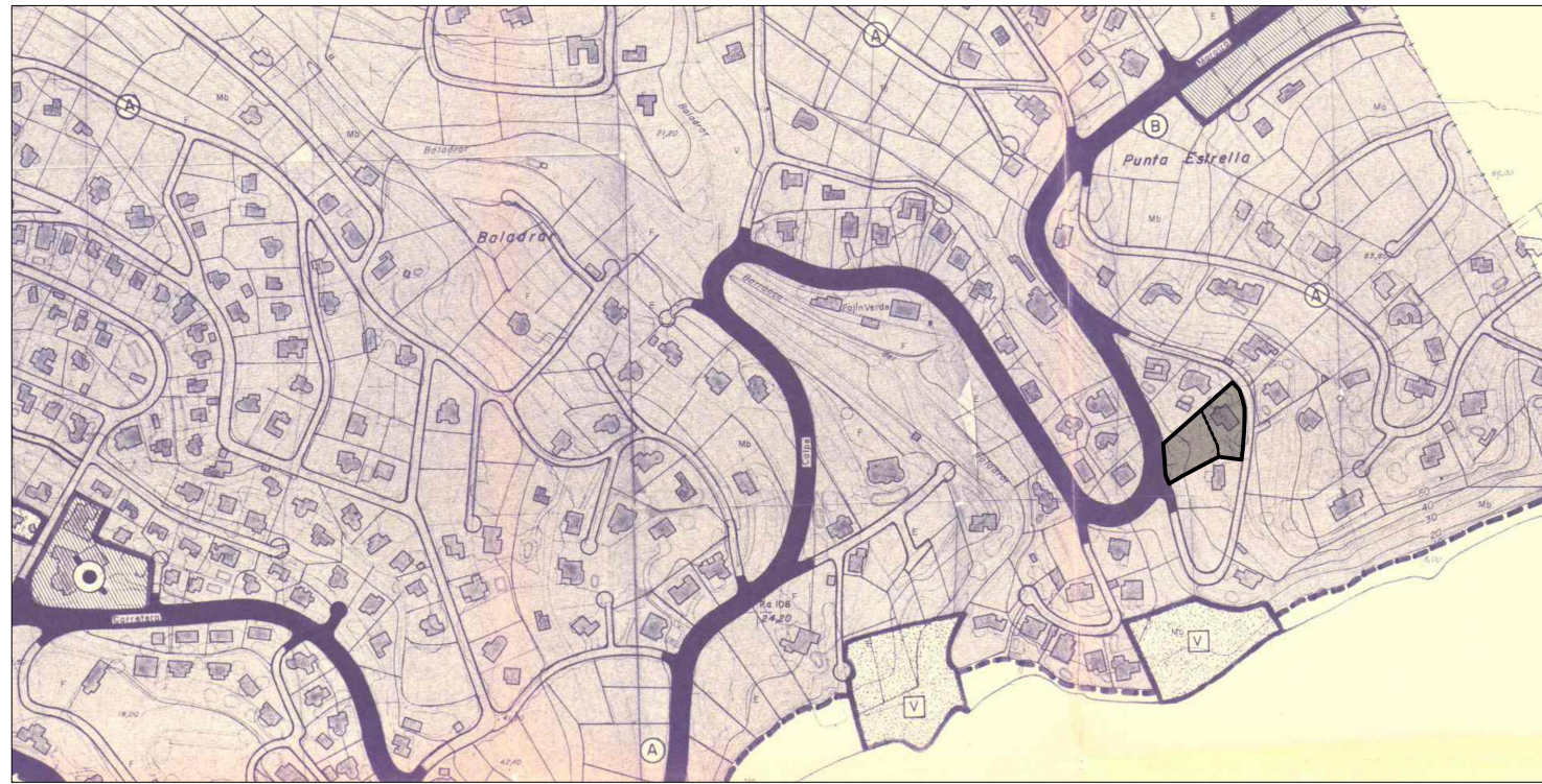
SITUACIÓN ESCALA 1:15000